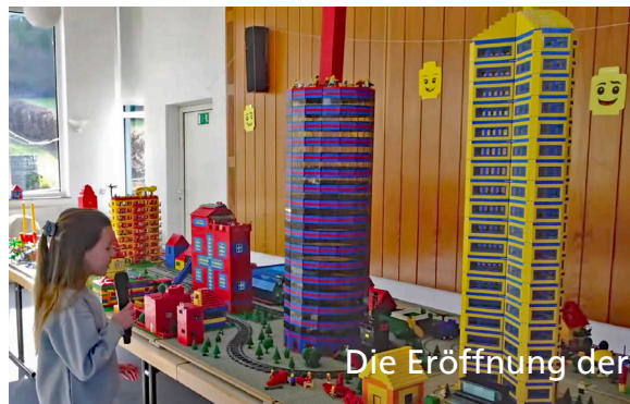
Die Eröffnung der Legostadt